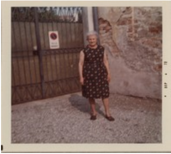
Soggetti Erina Oiraw

Titolo Casa Chiappa Segnatura 16.2.037 F Luogo Crema, via Tadini Data 09/1973 Tecnica Gelatina ai sali d'argento\ Carta Autore NN